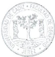
Departamento Derecho Público